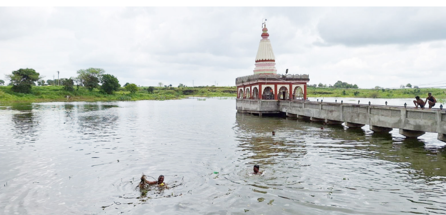
रिसोड - तलावातील जलपर्णी व इतर वनस्पती काढत असताना भरजहागीर येथील युवक