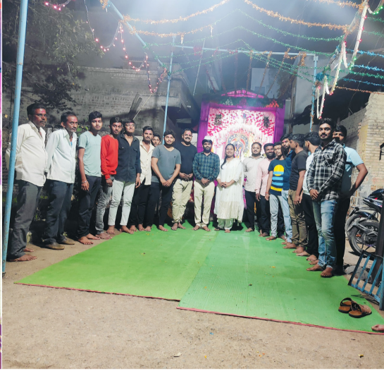
त्यांची मतदार संघात चांगली ओळख असल्याने त्यांना