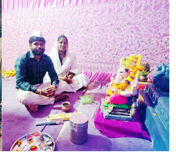
चांगला प्रतिसाद मिळत आहे तर त्यांना आरतीसाठी बोलण्यात विविध गणेश मंडळांकडून सुद्धा येत आहे.