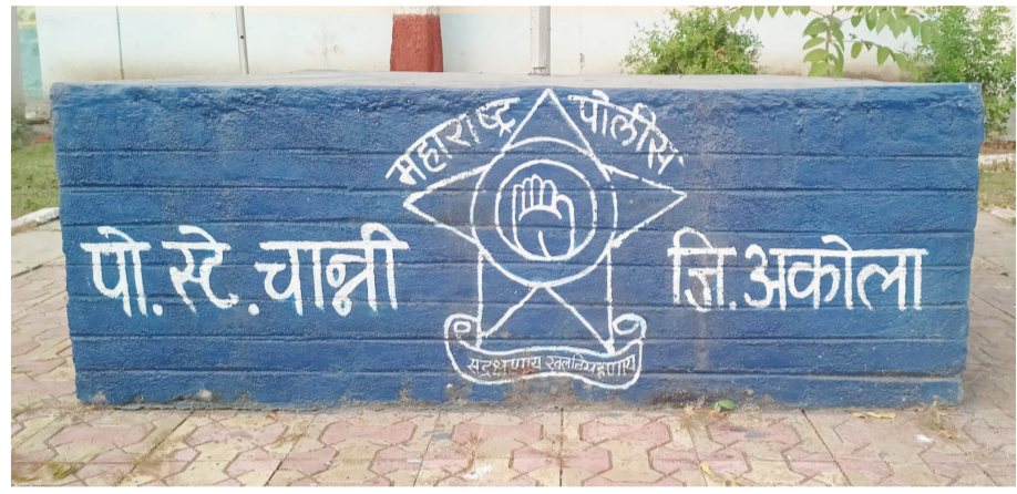
१८ पोलीस पाटलांची पदे रिक्त असल्याने त्या गावातील माहिती पोलीस प्रशासनाला मिळण्यास

पातूर : पोलीस विभाग व ग्रामस्थ यांच्या दरम्यानची कळी म्हणजे पोलीस पाटील असते, गाव पातळीवर कुठल्याही प्रकारची अनुचित घटना, आत्महत्या, व अवैध धंदे वादविवाद आदी बाबतची माहिती पोलीस पाटलांना पोलीस प्रशासनाला द्यावी लागते, यास उद्देशाने शासनाने पोलीस पाटलांच्या नियुक्त्या केल्या होत्या मात्र पातूर तालुक्यातील चात्री ठाणे हद्दीतील गेल्या अनेक वर्षांपासून चात्री ठाणे हद्दीतील चांगोफळ झरंडी वसाली उंबरवाडी पिंपळडोळी जांब मळसुर तुलगां खुर्द अंधार सांगवी सांगोळा बु. पांगरा उमरा शिरपूर सस्ती सायवणी धाडी चात्री आदी