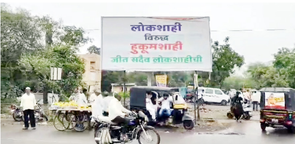
बुलढाणा शहरात लोकशाही विरुद्ध हुकूमशाही अशा आशयाचा झळकला बॅनर