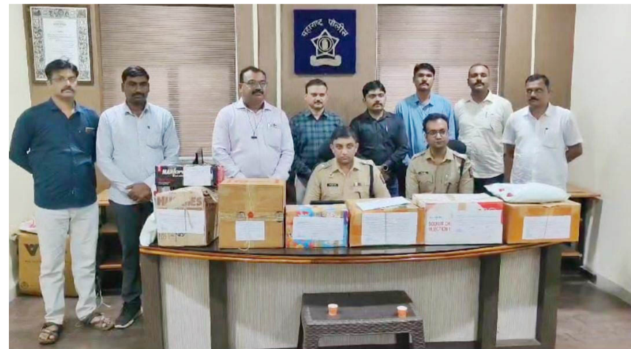
०७ सप्टेंबर रोजी सदर गुन्हाचा तपास स्थानिक गुन्हे शाखेकडे देण्यात आला असून अटक