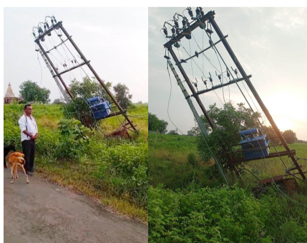
मात्र अनुचित प्रकार घडण्याची भीती निर्माण झाली आहे.

डोणगाव/प्रतिनिधी : डोणगाव येथील महावितरणचे सहाय्यक अभियंता यांच्या निष्काळजीपणामुळे शेतकऱ्यांचा जीव टांगणीला लागला असून अनेक शेतकरी त्रस्त झाले आहेत.डोणगाव परिसरातील कव्हाळवाडी फाटा येथील रोहित हे गेल्या अनेक महिन्यांपासून नादुरुस्त आहे.सादर रोहित दुरुस्त करण्यासाठी वारंवार मागणी करण्यात आल्यानंतरही महावितरणचे सहाय्यक अभियंता यांचे याकडे अक्षय्य दुर्लक्ष होत आहे. या नादुरुस्त रोहित्रा मुळे