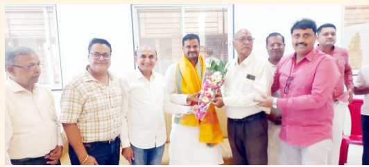
खासदार धोत्रे यांचा सत्कार करत असताना व्यापारी महाराष्ट्राचे पदाधिकारी