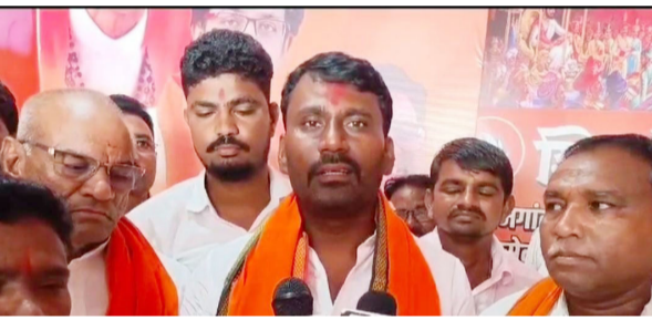
हेच ही योजना येत्या काळात बंद करतील. तर ही योजना फक्त निवडणुकीपूर्वी असून महिलांना हे मत विकत घेण्याचा प्रकार आहे. मुख्यमंत्री एकनाथ शिंदे व उपमुख्यमंत्री देवेंद्र फडणवीस यांनी काही घाम गाळून पैसा जमा केला नसून हा जनतेचाच पैसा जनतेला वाटायला निघतो आहे. लाडक्या बहिणी योजनेची