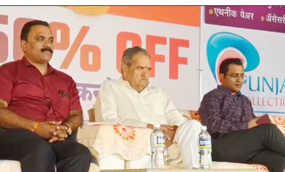
मैदानावर गरबा फेस्टिवल चे आयोजन करण्यात आले आहे.. बुलडाणा अर्बन गरबा फेस्टिवल २०२४ चे आयोजन

बुलडाणा/प्रतिनिधी : भारतीय संस्कृतीचे जतन व संवर्धन करण्यासोबतच शहरी व ग्रामीण भागातील मुले, मुली, युवक-युवतींना आपली गरबा दांडिया कला सादर करण्यासाठी व्यासपीठ व संधी मिळावी यासाठी बुलडाणा अर्बन परिवाराच्या वतीने मागील १८ वर्षांपासून गरबा फेस्टिवलचे आयोजन केले जाते. यावर्षी सुध्दा नवरात्रोत्सवानिमित्त स्थानिक शारदा ज्ञानपीठचे