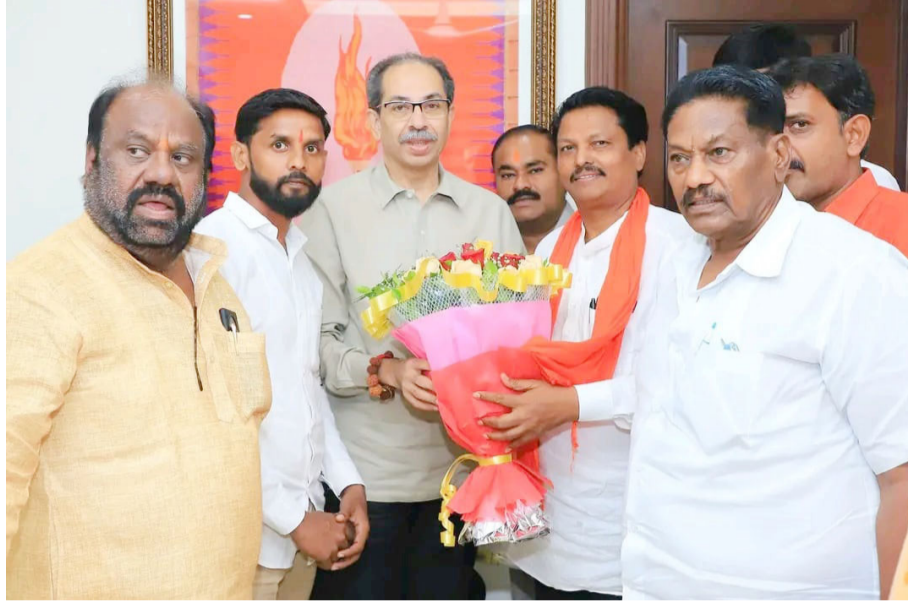
गत काही दिवसांपूर्वी शिवसेना गटाच्या वतीने मेहकर करण्यासाठी मेहकर लोणार उद्धव बाळासाहेब ठाकरे येथे चेतना, संवेदना जागृत विधानसभा मतदार संघात

मं ह क र / प्रतिनिधी : बुलडाणा जिल्ह्यातील राजकारणाचा केंद्रबिंदू असलेल्या व शिवसेनेचा बालेकिल्ला म्हणून ओळख असलेल्या मेहकर लोणार विधानसभा मतदार संघ आपल्या ताब्यात घेण्यासाठी उद्धव बाळासाहेब ठाकरे शिवसेनेच्या वतीने जोरदार फिल्डिंग लावून तयारी सुरू केली आहे. अशातच आता अवघ्या महिना दीड महिना राहिलेल्या विधानसभा निवडणुकीपूर्वी शिवसेना पक्षप्रमुख उद्धव ठाकरे यांनी मेहकर लोणार विधानसभा मतदार संघातील इच्छुक उमेदवारांसह पदाधिकाऱ्यांची बैठकीत घेऊन मतदारसंघातील आढावा घेतला.