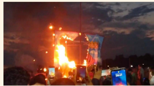
दैनिक आपला विदर्भ