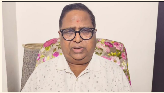
दैनिक आपला विदर्भ