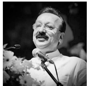
मुख्यमंत्री एकनाथ शिंदे यांनी मुख्यमंत्री कार्यालयाच्या 'एक्स'

मुंबई/प्रतिनिधी : राष्ट्रवादी अजित पवार गटाचे ज्येष्ठ नेते बाबा सिद्दीकी यांच्यावर दि. १३ ऑक्टोबर रोजी रात्री गोळीबार करून त्यांची हत्या करण्यात आली. मृत घोषित केल्यानंतर त्यांचा मृतदेह शवविच्छेदनासाठी कूपर रुग्णालयात नेण्यात आला आहे.