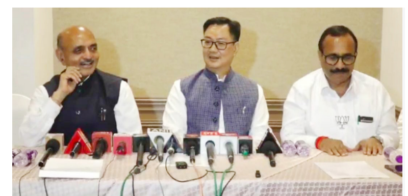
काँग्रेसच्या संविधान मितवण्याच्या एक आण देशात काम सुरु असल्याचे पत्रकार नेरेटीव्हवर किरण रिजुजू यांचे महाराष्ट्र परिषदेतून स्पष्ट होत आहे.

महाराष्ट्रात आहे. मी पण हिमाचल मधील बौद्ध आहे. काँग्रेसने जे वाईट करून ठेवले आहे ते चांगले करावे आहे. महाराष्ट्रात सर्व जातींना आम्ही समोर घेऊन जात आहोत. सर्वात जास्त मद्दत करायची गरज आहे, ती लेण्यांना आम्ही त्यांना आर्थिक सहाय्य करू, महाराष्ट्रात प्रत्येक जिल्ह्यात संविधान निर्माण भवन उभारणार आहे. संविधान सर्वात मोठे आहे. देशात काही लोक चुकीची माहिती पसरवत आहे. बाबासाहेबांना जे मानत नाही ते आता संविधान वर बोलत आहे. संविधान संपवण्याचे काम काँग्रेसने केले. असा आरोप केंद्रीय मंत्री किरण रिजिजू यांनी केला.