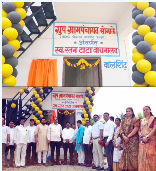
दैनिक आपला विदर्भ

भिवंडी/प्रतिनिधी : वालशिंद ग्रामपंचायतच्या वतीने, स्वर्गीय रतन टाटा यांच्या नावाने उभारण्यात आलेल्या वाचनालयाचे उद्घाटन मोठ्या उत्साहात करण्यात आले. या वाचनालयासाठी तब्बल २० लाख रुपयांचा निधी वापरण्यात आला आहे, जो स्थानिक ग्रामपंचायतने मंजूर केला होता.