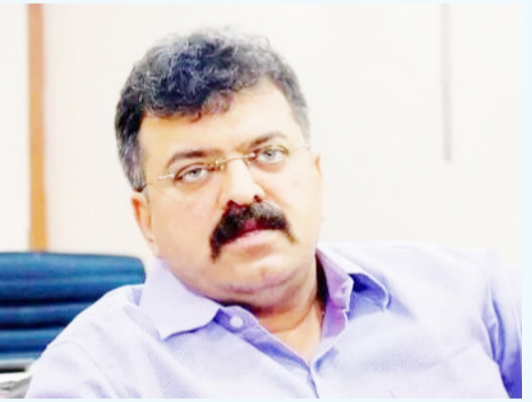
दैनिक आपला विदर्भ

मुंबई/प्रतिनिधी : राष्ट्रवादी काँग्रेसचे नेते बाबा सिद्दीकी यांना सिव्क्युरिटी असतानाही उडवले आहे. ही बाब अत्यंत गंभीर आहे.कायदा आणि सुव्यवस्थेचा धुवा उडलेला आहे. खासदार, आमदार, नेते सुरक्षित नसतील तर या सरकारला सत्तेत राहण्याचा अधिकार नाही. सरकारने राजीनामा द्यावा, अशी प्रतिक्रिया जितेंद्र आव्हाड यांनी देत सरकारवर टीका केली. प्रसार माध्यमांशी बोलताना ते म्हणाले की,गुन्हेगार कुलामध्ये भांड्याच्या घरात राहत होता. खबरीपासुन ते मुंबई पोलिसांनी सर्व ताब्यात ठेवण्याचे अतिशय प्रयत्न केले. मुंबई पोलिसांनी मुंबई उत्तम सांभाळली आहे. सिव्क्युरिटी मध्ये असणाऱ्या माणसाला असं उडवलं जात असेल तर ही चांगली गोष्टी नाही.कायम हसनार सिद्दीकींच व्यक्तिमत्व होत.जे काही झालं ते मुंबई पोलिसांना आणि सरकारला शोभणार नाहीये, सामान्य नागरिकांपासून आमदार, खासदार, नेते सुरक्षित नसतील तर या सरकारला सत्तेत राहण्याचा काही अधिकार नाही.मुंबई - पुण्यात गेल्या सहा महिन्यांपासून हत्या बलात्कार होतायत. सरकारने आपले नैतिक जबाबदारी पत्करून राजीनामा दिला पाहिजे, असे मत आमदार जितेंद्र आव्हाड यांनी व्यक्त केले.