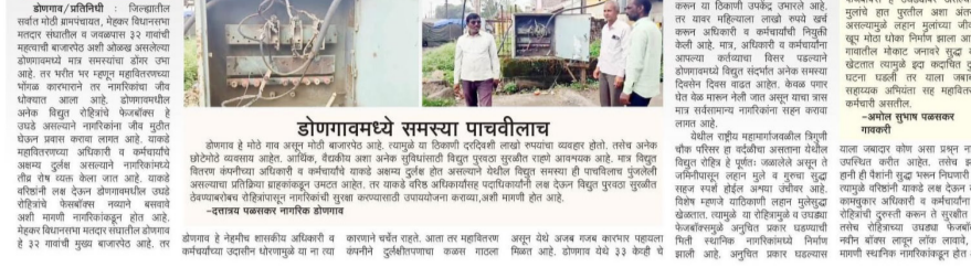
डोणगावमध्ये समस्या पाचवीलाच

महावितरणच्या अधिकारी कर्मचाऱ्यांना पडला कर्तव्याचा विसर : वरिष्ठांनी लक्ष देण्याची गरज