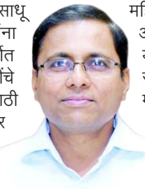
युवक-युवती, महिला यांनी मतदार यादीमध्ये नाव नोंदविले

नाही, त्यांनी आपले संबंधित मतदान केंद्रावर नियुक्त मतदान केंद्रस्थरीय अधिकारी (इडज), संबंधित तहसिल कार्यालय यांचेशी संपर्क साधून आपले नाव मतदार यादीत समाविष्ट करून घ्यावे. तसेच सर्व मतदारांनी विधानसभा निवडणूक 2024 मध्ये सर्व सातही विधानसभा मतदार संघातील जास्तीत जास्त प्रमाणात विक्रमी मतांची नोंद करून मतदानाची टक्केवारी वाढविण्याचे आवाहन जिल्हाधिकारी डॉ. किरण पाटील यांनी केले आहे.