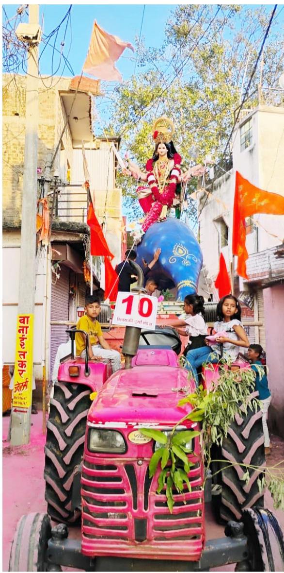
मिरवणुकीतील सर्व नवदुर्गा पुष्पहार अर्पण करून आशिर्वाद मंडळाची पुजा-अर्चा करून घेतले. मिरवणुकीची सुरुवात

विसर्जन मिरवणूकिला सकाळी साडेअकरा वाजता पासून सुरुवात झाली. यामध्ये आई जगदंबा माईची भव्य मुर्ती सुशोभित सजविलेल्या वाहानावर आरूढ करून समोर ढोल ताशासह डिजे च्या वाद्यांच्या गजरात फुलांची उधळण करीत मंगल वाद्यांच्या गजरात आई भवानी, जगदंबा, अंबाबाईच्या जयजयकारात मिरवणूक शहरातील प्रमुख मार्गावरून काढण्यात आली. शहरातील रस्त्यावर सडा टाकून महिलांनी ठिकठिकाणी रांगोळीने रस्ते सजविले होते. ठिक- ठिकाणी विसर्जन मिरवणुकीत महिलांनी ओवाळून