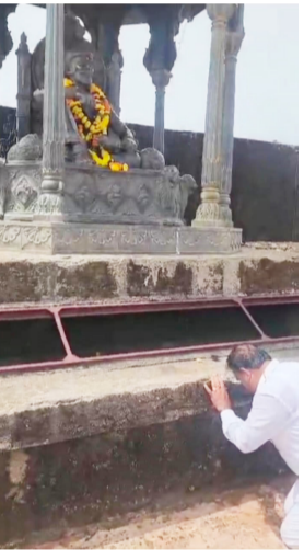
रोजी बुलडाणा मतदार

आगामी काळात विधानसभेच्या निवडणुका होत आहे या निवडणुकीत ऊर्जा मिळावी व विजय व्हावे यासाठी पुन्हा 93 ऑक्टोबर