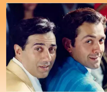
एकाच चित्रपटात सनी देओल आणि बाँबी देओल, बॉक्स ऑफिसवर घालणार धुमाकूळ!