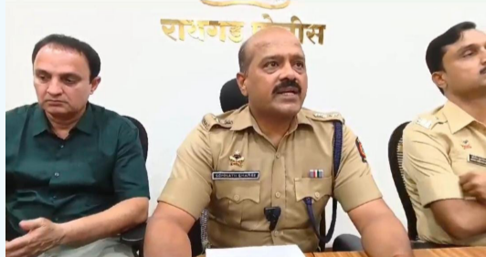
दैनिक आपला विदर्भ

कर्जत पोलीस ठाणे हद्दीत बनावट सिगारेट तयार करणाऱ्या फार्म हाऊसवर धाड