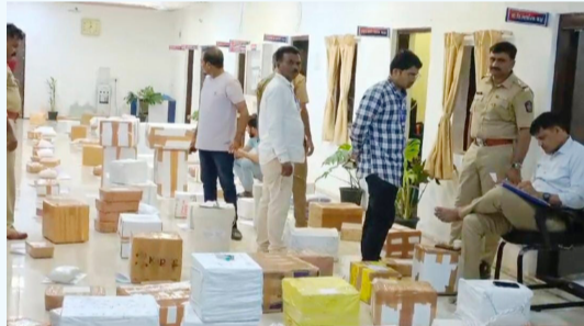
दैनिक आपला विदर्भ

पिकअप वाहनाची तपासणी आठ कोटी रुपयांची चांदीच्या वस्तू सापडल्याने वाहन पोलिसांच्या ताब्यात