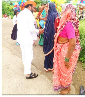
हजारो कोटींचा निधी, त्या माध्यमातून