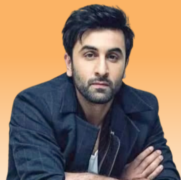
संजय लीला भस्कारांनी सोव्हर केला एवढा 'छळ', चित्रपट सोडणार होता रणवीर कपूर