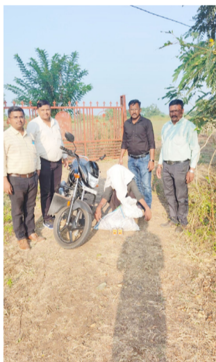
दैनिक आपला विदर्भ