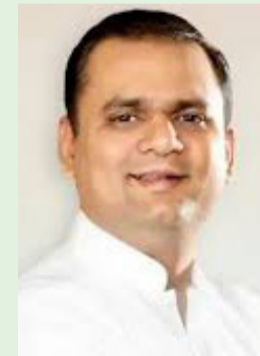
माहिती समोर आली आहे.

मुंबई/प्रतिनिधी : महाराष्ट्राचे मुख्यमंत्री म्हणून भाजप नेते देवेंद्र फडणवीस उद्या शपथ घेणार आहेत. या शपथविधी सोहळ्याला पंतप्रधान नरेंद्र मोदी यांच्यासह भाजपचे वरिष्ठ नेते उपस्थित राहणार आहेत. आज सकाळी भाजपच्या आमदारांची बैठक झाली. या बैठकीत देवेंद्र फडणवीस यांची भाजपचे विधिमंडळ पक्षाचे नेते म्हणून निवड करण्यात आली. यानंतर देवेंद्र फडणवीस, एकनाथ शिंदे आणि अजित पवार हे तीन नेते राज्यपाल सी.पी. राधाकृष्णन यांच्या भेटीला गेले आहेत. या घडामोडी सुरु असतानाच महाराष्ट्राच्या विधानसभेचे अध्यक्ष कोण असणार याबाबतची