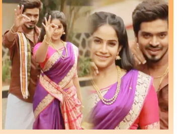
'सावळ्याची जणू सावली' फेम प्राप्ती रेडकरचा 'पुष्पा २' मधील 'अंगारो' गाण्यावर जबरदस्त डांस