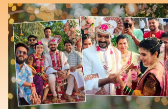
'देवमाणूस' फेम अभिनेता किरण गायकवाड अडकला विवाहबंधनात