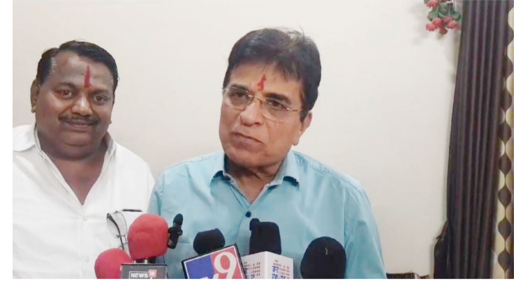
राम आठवतो त्यांच्या पक्षाची आता शेवटची वेळ आलेली आहे. मुंबई महापालिकेच्या निवडणुकीनंतर उद्भव ठाकरेच्या सेनेचा अस्तित्त्व नसेल अशी प्रतिक्रिया किरीट सोमय्या यांनी व्यक्त केली आहे.

याचा हा विजय असल्याची प्रतिक्रिया किरीट सोमय्या यांनी व्यक्त केली आहे. दादर येथील हनुमान मंदिरात काल झालेल्या प्रकाराबाबत किरीट सोमय्या यांनी प्रतिक्रिया व्यक्त केली असून उद्भव ठाकरेचे गँगस्टर जे करतात त्याला राडा असे म्हणत नाहीत. उद्भव ठाकरे आणि संजय राऊत यांनाच ही भाषा शोभते. उद्भव ठाकरेच्या पोराला काय अधिकार आहे ज्यांनी हनुमान चालीसा म्हणणाऱ्यांना जेलमध्ये टाकले. तिथे मी गेलेलो असताना मला मारण्यासाठी गाडी पेटवण्याचा प्रयत्न झाला त्या उद्भव ठाकरेना आता राम का आठवला आपली संस्कृती आहे, आपली शेवटची वेळ आल्यावर आपल्याला