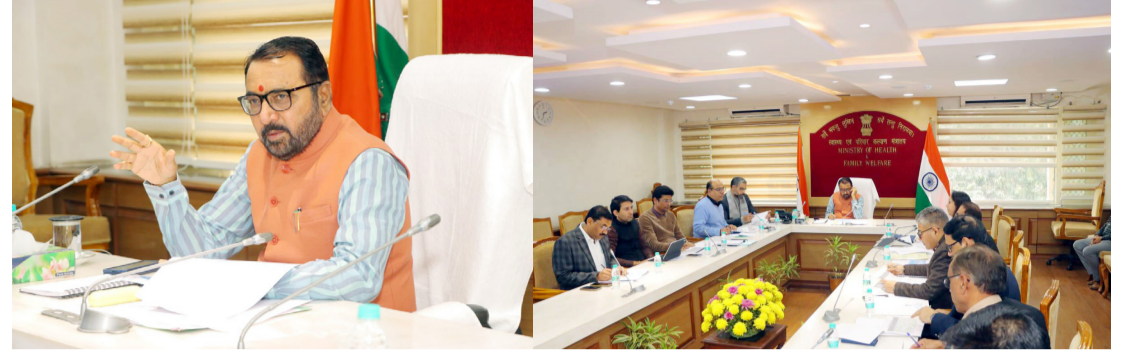
सहज आरोग्य सुविधा मिळण्याच्या सूचना केली सोबत आरोग्य विषय या बैठकीला आरोग्य विभागाची वरिष्ठ दृष्टिकोनातून उपाय योजना करा अशी विविध विषयावर चर्चा करण्यात आली. अधिकारी प्रामुख्याने उपस्थित होते.

मंत्रालयाच्या दालनात केंद्रीय आरोग्य व कुटुंब कल्याण राज्यमंत्री प्रतापराव जाधव यांच्या अध्यक्षतेखाली बैठक संपन्न झाली. या बैठकीला आरोग्य विभागाचे अधिकारी उपस्थित होते. यावेळी मार्गदर्शन करताना ते पुढे म्हणाले की, पंतप्रधान नरेंद्र मोदी यांच्या नेतृत्वात आणि केंद्रीय आरोग्यमंत्री जे पी नड्डा यांच्या मार्गदर्शनाखाली देशातील प्रत्येक नागरिकांना उत्तमातील उत्तम आरोग्यसेवा देण्यासाठी आपले सरकार कटिबद्ध आहे. त्या दृष्टिकोनातून येणाऱ्या अर्थसंकल्पात आरोग्यसेवा अधिक सक्षम करून नागरिकांना