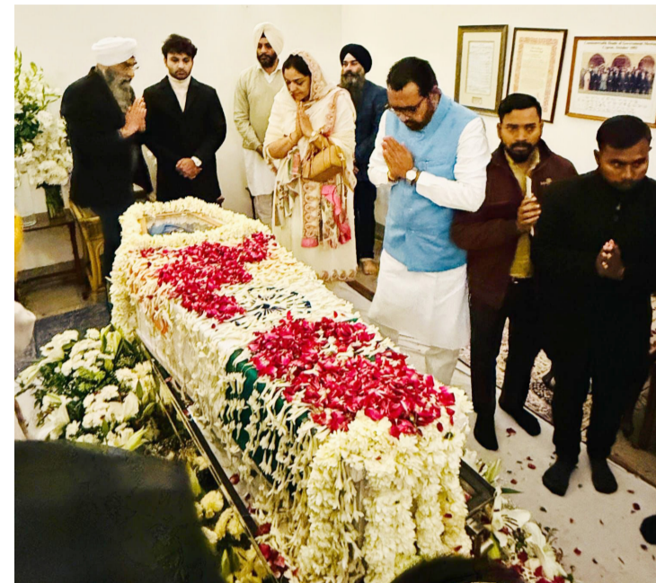
श्रद्धांजली अर्पण करतो, अशा शब्दांत त्यांनी शोकभावना व्यक्त केल्या.

त्यांच्या निधनाने देशाचे सभ्य, सुसंस्कृत, विश्र्वासार्ह नेतृत्व हरपले आहे. देश आपल्या सुपुत्राला मुकला आहे. देशाचे यशस्वी अर्थमंत्री, साहसी पंतप्रधान आणि जनमानसाचा विश्र्वास प्राप्त केलेला नेता म्हणून ते कायम स्मरणात राहतील. त्यांना केंद्रीय आयुष, आरोग्य व कुटुंब कल्याण राज्यमंत्री या नात्याने मी