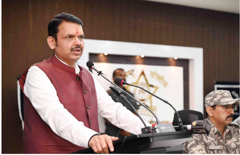
दैनिक आपला विदर्भ

गडचिरोली/प्रतिनिधी : नववर्षाचा पहिला दिवस गडचिरोलीसाठी विकासाची नवीन पहाट घेवून आला असून विकासाच्या, सामाजिक सलोख्याच्या, शांततेच्या आणि औद्योगीकरणाच्या दिशेने गडचिरोलीची वाटचाल सुरू राहिल, असा विश्वास मुख्यमंत्री देवेंद्र फडणवीस यांनी आज येथे व्यक्त केला.