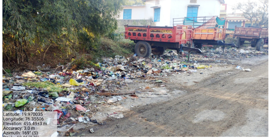
Latitude: 19.970035 Longitude: 76.35506 Elevation: 495.49±3 m Accuracy: 3.0 m Azimuth: 169° (S)