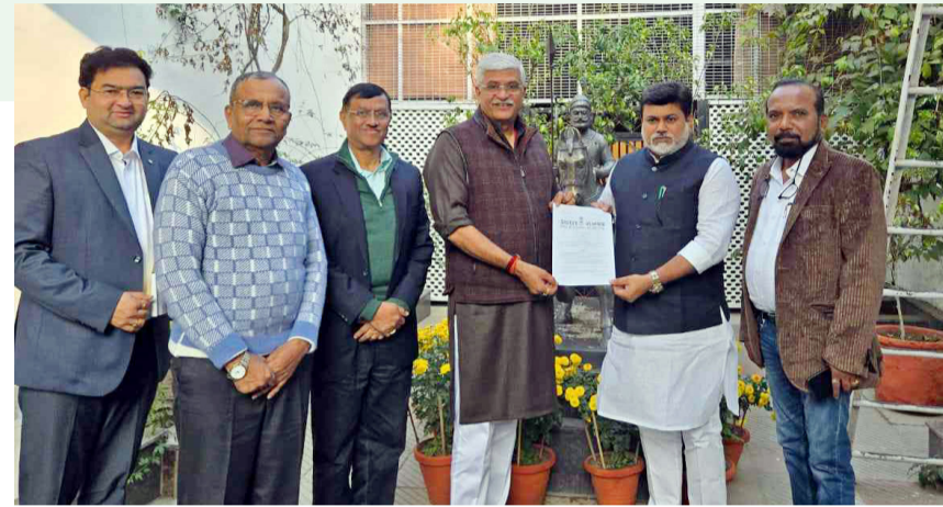
मराठी भाषेला अभिजात भाषेचा मान मिळाल्याबाबतची अधिसूचना आज केंद्रीय सांस्कृतिक मंत्री गजेंद्र सिंह शेखावत यांनी मराठी भाषा मंत्री उदय सामंत यांच्याकडे सुपूर्त केली

भाषेच्या निकषात सुधारणा करण्यात आली आणि संस्कृतला हा दर्जा मिळाला होता. अभिजात भाषा ठरवण्यासाठी त्या भाषेचा इतिहास हा दीड ते दोन हजार वर्षे जुना असणं गरजेचं आहे. प्राचीन साहित्यग्रंथांचा एक भाग, ज्याला वक्त्यांच्या पिढ्यांकडून मॉल्यवान वारसा म्हणून गणलं जातं. दुसऱ्या भाषेतून सदर भाषा उसनी घेतलेली नसावी. तसेच त्याची एक स्वतंत्र साहित्य परंपरा असावी. प्राचीन भाषा आणि आधुनिक भाषेत फरक असणं गरजेचं आहे.