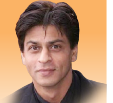
शाहरुख खानच्या घराभोवती संशयास्पद हालचाली, CCTV कॅमेऱ्यातून धक्कादायक खुलासे