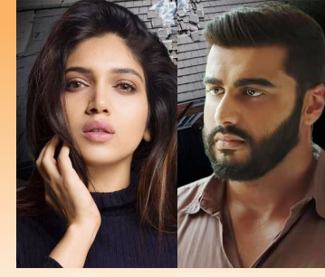
अर्जुन कपूर, भूमी पेडणेकरच्या रूटिंग दरम्यान दुर्घटना

■ दैनिक ■ बुलढाणा ■ वर्ष 03 रे ■ अंक 158 ■ रविवार, दि. 19 जानेवारी 2025 ■ पाने 4 ■ किंमत रु. 2 ■ RNI.NO.MAHMAR/2023/88006