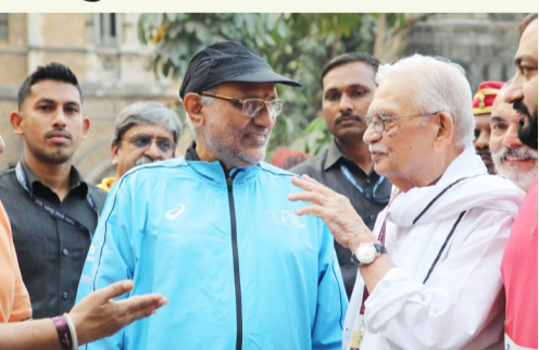
दैनिक आपला विदर्भ