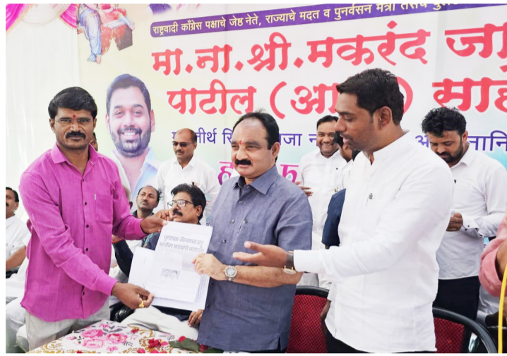
पडले असून मिट्टी उघडली असल्याने वाहनधारकांचे अनेक अपघात होतात मार्गाची अवस्था अत्यंत बिकट झाली पावसाळ्यात तर जिवघेणी कसरत आहे रात्री खड्डे चुकवण्याच्या नादात करावी लागते व अशा आशयाचे निवेदन

सिंदखेडराजा मतदार संघातील शेवटच्या टोकावर असलेल्या व लोणार तालुक्यातील भुमराळा ते किनगाव जट्टू या मुख्य भागातील रस्त्यांची अत्यंत दुरवस्था झाली आहे गेल्या तीन वर्षांपासून भुमराळा किनगाव जट्टू मार्गावर खड्ड्याचे साम्राज्य निर्माण झाले आहे त्यामुळे ग्रामस्थांच्या नशिबी अजूनही भोग सुरुच आहे या मार्गावर ये जा करणारे वाहन चालक,शेतकरी, विद्यार्थी, अक्षरशा त्रस्त झाले आहे आज घडीला हा मार्ग विद्यार्थ्यांसाठी व वाहनधारकांसाठी जीवघेणा ठरत आहे भुमराळा येथुन हा मार्ग मुख्य मार्ग व जागतिक लोणार सरोवर ते संभाजीनगर मार्गाला जोडल्या गेला असुन या मार्गाने गावकरी, शेतकरी, शेतमजूर, विद्यार्थीची मोठी वर्दळ असते परंतु मार्गावर जागोजागी मोठ मोठे खड्डे