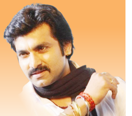
छावा सिनेमात झळकणार प्रसिद्ध मराठी अभिनेता, साकारणार 'ही' दमदार भूमिका..! आतील पान

■ दैनिक ■ बुलढाणा ■ वर्ष 03 रे ■ अंक 168 ■ बुधवार, दि. 29 जानेवारी 2025 ■ पाने 4 ■ किंमत रु. 2 ■ RNI.NO.MAHMAR/2023/88006