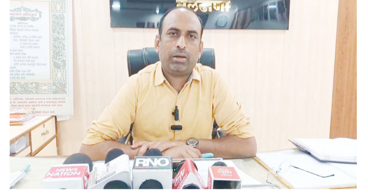
दैनिक आपला विदर्भ

बुलढाणा / प्रतिनिधी : देवाची करणी आणि नारळात पाणी असं म्हणतात ना त्यात तसला काही प्रकार बुलढाणा जिल्ह्यात दिसून आला आहे. आईच्या पोटात बाळ आणि त्या बाळाच्या पोटातही बाळ असेल असे शक्य नाही पण असे घडले आहेत. बुलढाणा जिल्हा सामान्य रुग्णालयात तीन दिवसांपूर्वी एका गर्भवती महिला सोनोग्राफी साठी जिल्हा सामान्य रुग्णालयात आली असता हा धक्कादायक प्रकार समोर आला आहे. ही ३२ वर्षीय महिला असून तिला याआधी दोन अपत्य आहेत. निसर्गाने मानवाची अशा प्रकारे रचना केली आहे की विशिष्ट वयानंतर आणि शरीर रचनेत बदल झाल्यानंतर फक्त महिलाच प्रजनन करू शकतात. मात्र, आईच्या पोटात बाळ