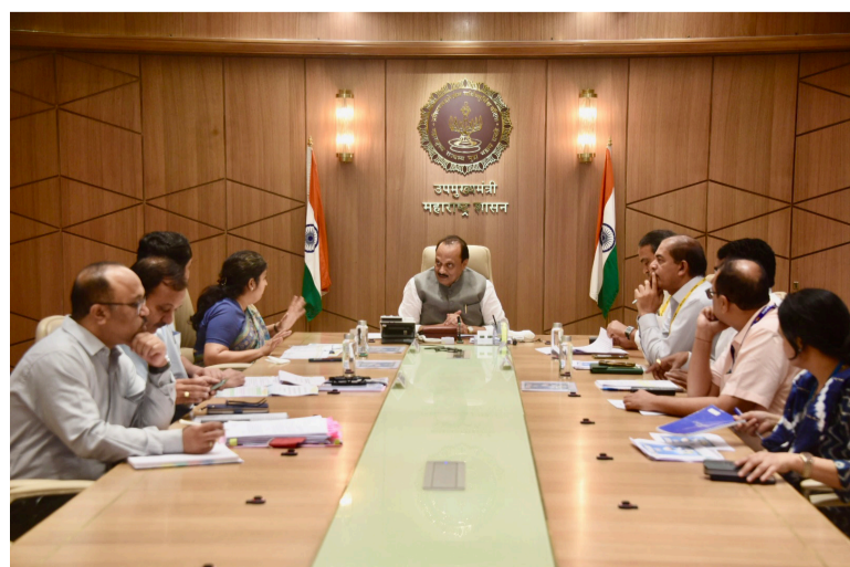
अजित पवार यांनी दिले.

मुंबई/प्रतिनिधी : प्रधानमंत्री नरेंद्र मोदी यांनी केलेल्या आवाहानुसार व केंद्र शासनाच्या 'पीएम सूर्यघर मुक्त बिजली योजने' अंतर्गत दिलेल्या मार्गदर्शक सूचनेनुसार राज्यांमधील सर्व शासकीय इमारतींचे १५ डिसेंबर २०२५ पूर्वी सौरऊर्जेद्वारे विद्युतीकरण करण्याचे उद्दिष्ट ठेवण्यात आले आहे. त्या अनुषंगाने राज्यातील सर्व शासकीय इमारतींचे सौर ऊर्जेद्वारे विद्युतीकरण करणे आवश्यक असून शासनाच्या १०० दिवसांच्या कार्यक्रमांतर्गत हा एक महत्त्वाचा उपक्रम आहे. त्याप्रमाणे सर्व शासकीय इमारतींचे विहित मुदतीत सौरऊर्जेद्वारे विद्युतीकरण करावे असे निर्देश उपमुख्यमंत्री तथा वित्त व नियोजन मंत्री