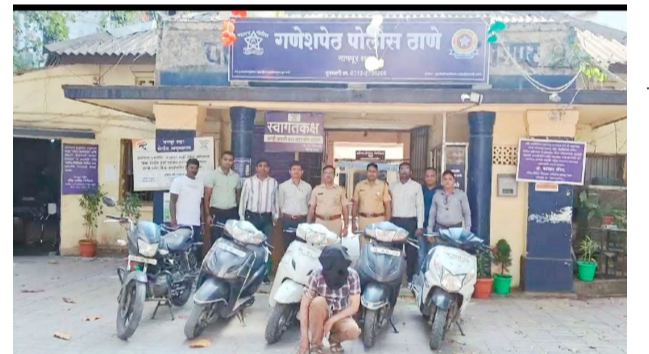
वरील असून याच्यावर वेगवेगळ्या गुन्हे दाखल आहेत. पोलीस स्टेशनमध्ये या आरोपीवर

दुचाकी चोरीला गेल्याची तक्रार दिली होती. त्याचा तपास सीसीटीव्ही आणि तांत्रिक माध्यमातून करत असताना एका संशयिताला पोलिसांनी ताब्यात घेतले आणि त्याची विचारपूस केली असता त्याने चोरी केल्याची कबुली दिली आहे. त्याच्याकडून चार गुन्हे उघाडकीस आणून सहा दुचाकी जप्त करण्यात आल्या आहेत. हा आरोपी एमडी झसचे व्यसन भागवण्याकरिता वाहन चोरी करत होता. हा रेकॉर्ड