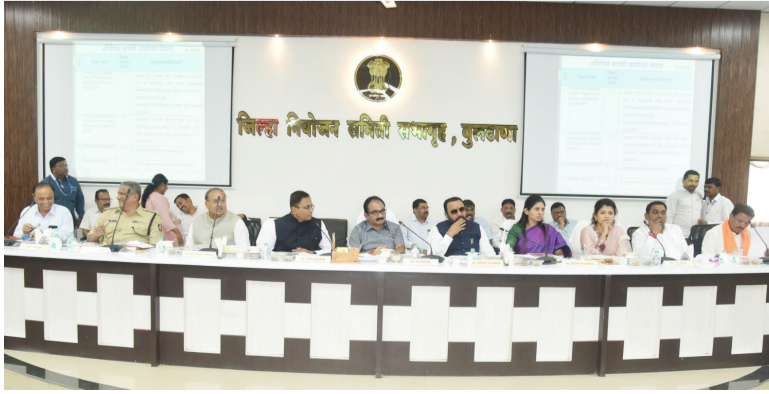
समितीच्या बैठकीत मान्यता देण्यात आली. निवडणुकीनंतर जिल्हाची पहिली