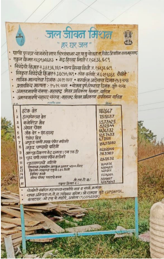
वाशिम जिल्ह्यात लागलेले जलजीवन मिशनचे...

■ पदधिकारी अधिकाऱ्याचे फलकाकडे दुर्लक्ष : नागरिकही संभ्रमात ■ लोकप्रतिनिधी या गंभीर बाबीकडे लक्ष देणार