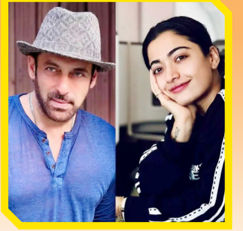
सलमान-रश्मिका यांची जोडी पुन्हा एकदा जमणार!