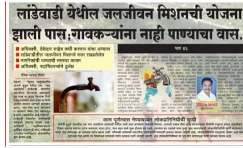
लाडेवाडी येथील जलजीवन मिशनची योजना झाली पास, गावकऱ्यांना नाही पाण्याचा वास..

ग्रामस्थांच्या तक्रारीला अधिकाऱ्याची केराची टोपली