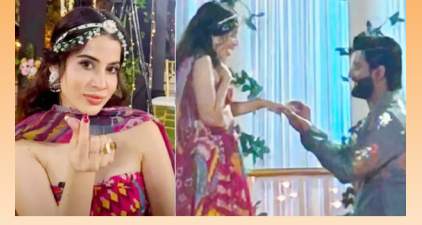
हॅलेंटाइनच्या मुहूर्तावर उर्फाने दिली गुड न्यूज! गुणवत्ता केला सारवरपुडा?