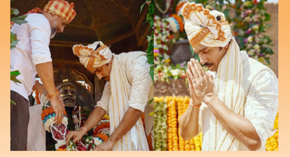
शिवजयंतीनिमित्त छावा 'संभा' चा शिवरायांना रायगडावर मुजरा, हात जोडत भावुकपणे म्हणाला...