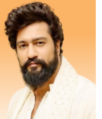
विकी कौशल स्टार 'छावा' चित्रपटात बॉक्स ऑफिसवर केला धमाका