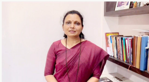
दैनिक आपला विदर्भ