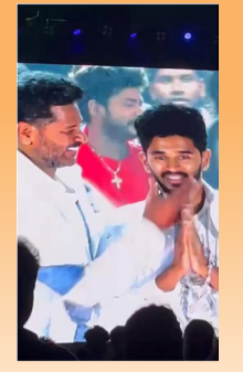
प्रभू देवा पहिल्यांदाच स्वतःच्या मुलाबरोबर थिरकला; 'पट्टी रेंप'वर लेकाकडून बापाला चॅलेंज