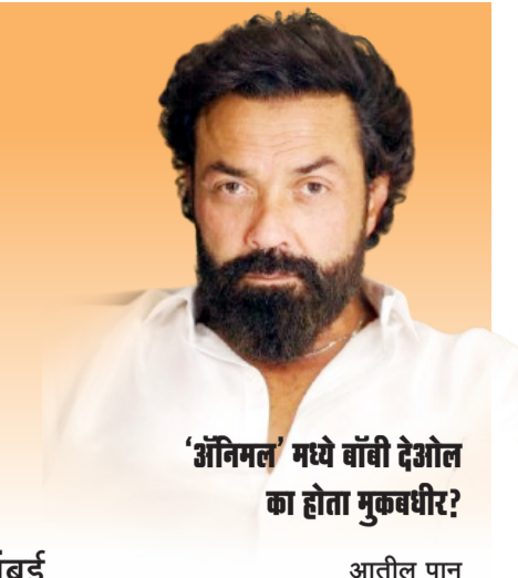
'अनिमल' मध्ये बांबी देओल का होता मुकबधीर?

■ दैनिक ■ बुलडाणा ■ वर्ष 03 रे ■ अंक 200 ■ रविवार, दि. 02 मार्च 2025 ■ पाने 4 ■ किंमत रु. 2 ■ RNI.NO.MAHMAR/2023/88006