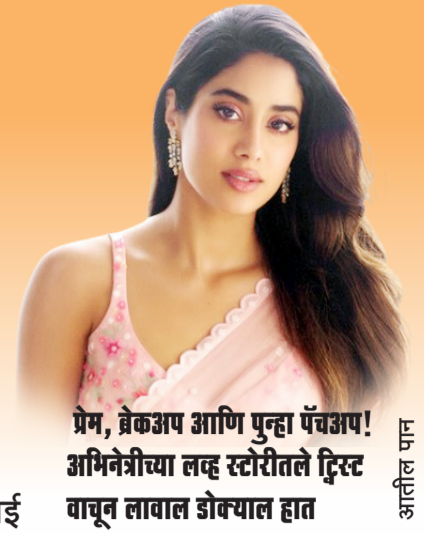
प्रेम, ब्रेकअप आणि पुन्हा पॅचअप! अभिनेत्रीच्या लव्ह स्टोरीतले ट्रिस्ट वाचून लावाल डोक्याला हात