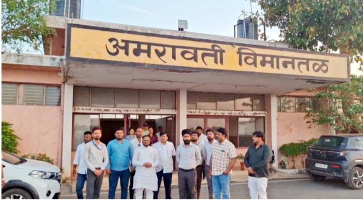
डॉ. अनिल बोंडे यांनी दिली. बोंडे यांनी विमानतळ प्राधिकरणाचे अधिकार्यांसोबत बैठक घेत प्रगतीत असलेल्या विमानतळाच्या

अमरावती/प्रतिनिधी : बहुप्रतिक्षित अमरावतीच्या बेलोरा विमानतळावरून अमरावतीकरांच्या टेकऑफची प्रतीक्षा संपणार आहे. विमानतळ इमारत निर्माणसह विविध प्रकारचे काम पूर्ण झाले असून, नागरी उड्डाण मंत्रालयाच्या उड्डाणा संदर्भातील परवानगीची प्रक्रियाही अंतिम टप्प्यात आली आहे. एप्रिलमध्ये अमरावती ते मुंबई अशी विमानसेवा सुरु होणार असल्याची माहिती राज्यसभा सदस्य