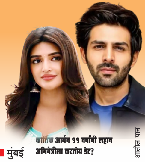
कांतिक आर्यन 99 वर्षांनी लहान अभिनेत्रीला करतोय डेट? कांतिक आर्यन

■ दैनिक ■ बुलडाणा ■ वर्ष 03 रे ■ अंक 212 ■ रविवार, दि. 16 मार्च 2025 ■ पाने 4 ■ किंमत रु. 2 ■ RNI.NO.MAHMAR/2023/88006