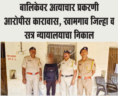
दैनिक आपला विदर्भ

बालिकेवर अत्याचार प्रकरणी आरोपीस कारावास, स्वामगाव जिल्हा व सत्र न्यायालयाचा निकाल