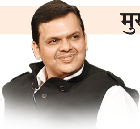
दैनिक आपला विदर्भ