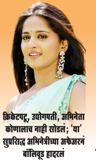
क्रिकेटपटू, उद्योगपती, अभिनेता कोणालाच नाही सोडलं; 'या' सुप्रसिद्ध अभिनेत्रीच्या अफेअरनं बॉलिवूड हादरलं