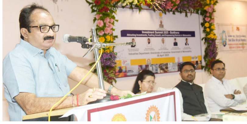
दैनिक आपला विदर्भ