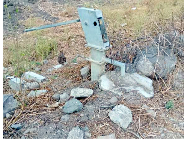
अंजनी ग्रामपंचायत अंतर्गत लांडेवाडी गावातील हातपंप नादुरुस्त..!

मेहकर/प्रतिनिधी : तालुक्यात पाणीटंचाईने भीषण रूप धारण केले असून नागरिकांना पाण्यासाठी तब्बल पाच पाच किलोमीटर रानोमाळ भटकंती करण्याची वेळ आली आहे. असे असताना ग्रामपंचायतीचे पाण्याचे स्रोत काही प्रमाणात मात्र बंद आहेत. एकीकडे भीषण पाणी टंचाई तर, दुसरीकडे मात्र तब्बल ४० लाखाच्यावर हात पंपाचा कर भरणा बाकी असल्याने अधिकारी पदाधिकाऱ्यांच्या या निष्काळजी पणाचा फटका? सर्वसामान्य जनतेला सहन करावा लागत आहे. एकीकडे पाण्यासाठी भटकंती सुरू असताना दुसरीकडे हातपंप दुरुस्ती कर भरणा न केल्याने हातपंप असून ओळंबा नसून खोळंबा अशी गत झाली आहे. याकडे अधिकाऱ्यांने गाभीर्याने लक्ष देण्याची गरज निर्माण झाली आहे.