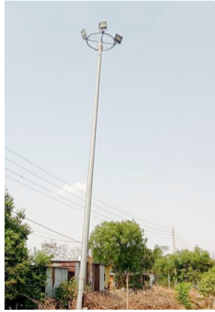
लांडेवाडी येथील हायमास्ट लाईट बंद..!

डोणगाव/प्रतिनिधी : गावात विविध सोयीसुविधा उपलब्ध व्हाव्यात, रात्रीच्या वेळेस अनुचित प्रकार घडू नये, रस्त्यावर प्रकाश राहावा, यासाठी लाखो रुपये खर्च करून उभ्या केलेल्या हायमास्ट लाईट खाली मात्र अंधार झाला आहे. अनेक दिवसांपासून तालुक्यातील अंजनी बुद्रुक अंतर्गत येत असलेल्या लांडेवाडी येथील हायमास्ट लाईट बंद असल्याने नागरिकांना विविध समस्यांना सामोरे जावे लागत आहे. त्याचबरोबर रात्रीच्या वेळेस महिला व मुलींना प्रवास करणे रस्त्यावरून जाणे भीतीदायक झाले आहे त्यामुळे याकडे ग्रामपंचायत प्रशासनाने लक्ष देऊन बंद असलेले हायमास्ट लाईट सुरू करावे अशी मागणी जनतेकडून होत आहे.