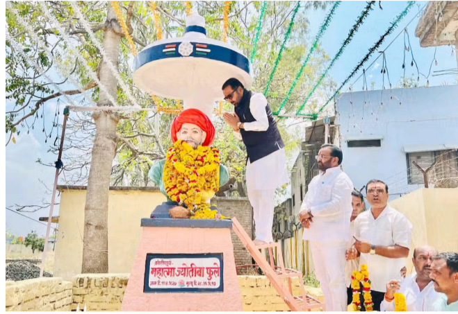
दैनिक आपला विदर्भ