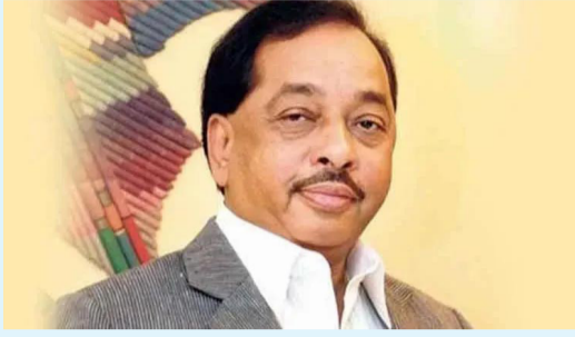
दैनिक आपला विदर्भ

कोणतीही मदत केली नसताना कोकणावर बोलायचा अधिकार नाही ; खासदार नारायण राणे यांची टिका