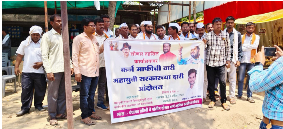
दैनिक आपला विदर्भ