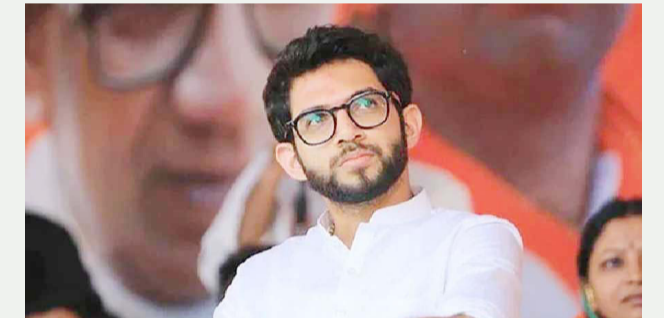
दैनिक आपला विदर्भ

मुंबई/प्रतिनिधी : महाराष्ट्राचे वाळवंट करणार असे सरकारने जाहीर करावे, म्हणजे आम्ही विचारणार नाही. पीक विमा कंपनी नेमका कुणाचा फायदा करतात हे देखील पहावे लागेल. असे मत माजी मंत्री आदित्य ठाकरे यांनी आयोजित पत्रकार परिषदेत व्यक्त केले. यावेळी ते म्हणाले की, मुंबईत आणि महाराष्ट्रात महत्वाचा विषय आहे. तो पाण्याचा मुंबईत अनेक इमारती चाळीमध्ये पाणी पोहोचण्याचे काम टँकर मार्फत केले जात आहे. मी आयुक्ताना पाणी प्रश्नावर बोलायला सांगितले होते.त्यांच्या मागण्या फार नाहीत. सरकारकडून फक्त प्रस्ताव मांडला जातो, तो राज्य सरकारकडून