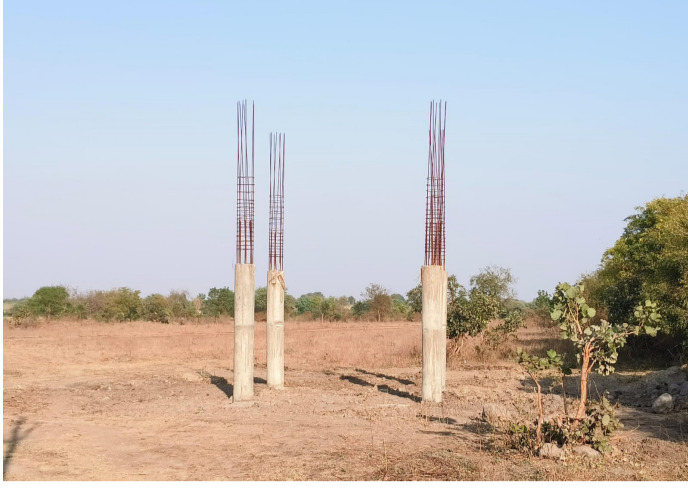
नागापूर येथील जल जीवन मिशन योजनेच्या अर्धवट असलेले पाण्याच्या टाकीचे बांधकाम..!