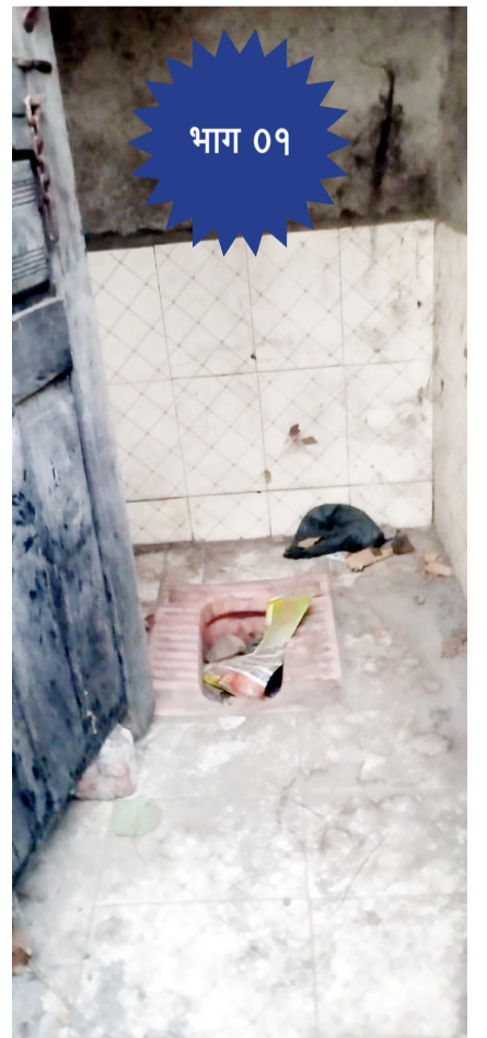
जिल्हा परिषद शाळेमध्ये स्वच्छतागृह..!

परिषदेच्या १५० नगरपरिषदेच्या ११ व शासकीय आश्रम शाळा एक अशा एकूण १६२ शाळांमध्ये स्वच्छतागृह व पिण्याच्या पाण्याची सुविधा असल्याचा शेरा शासन दसरी मारला असल्याचे चित्र वार्षिक अहवालात दिसून आले आहे. याबाबत लोकप्रतिनिधी व वरिष्ठानी गांभीर्याने दखल घेत कोण कोणाची दिशाभूल करतो याबाबत चौकशी करण्याची गरज निर्माण झाली आहे.