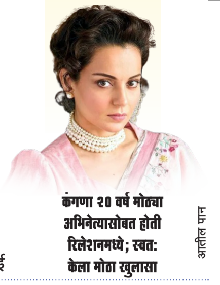
कंगणा २० वर्ष मोठ्या अभिनेत्यासोबत होती रितेशराममध्ये; स्वतः केला मोठा खुलासा