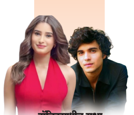
बॉलिवूडमधील रासा ठडानी आणि अभय वर्मा पडघावर दिसणार एकर