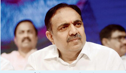
दैनिक आपला विदर्भ

नवी मुंबई/प्रतिनिधी: ड्रीमलाइनर हे एक सुरक्षित असं विमान समजलं जाते. त्यामुळे टेक्निकल काही तरी फॉल्ट झाला असेल, ब्लैक बॉक्स मधून समोर येईल नेमका कशामुळे अपघात झाला हे माहीत नाही. जी घटना घडली त्याची जबाबदारी घ्यायला पाहिजे. मात्र, अलीकडच्या काळात अशी काही जबाबदारी घेताना दिसत नाही. अशी प्रतिक्रिया बँकांवर होणारे सायबर अटॅक कसे थांबवावे, यासाठी प्रशिक्षण केंद्राचे आज वाशी येथे उद्घाटन करण्यात आले. यावेळी (शरदचंद्र पवार गट) राष्ट्रवादी काँग्रेस प्रदेशाध्यक्ष जयंत पाटील यांनी माध्यमांशी बोलताना दिली.