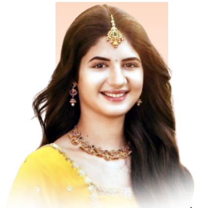
बजरंगी भाईजानची मुन्नी दिसणार साज्य चित्रपटात