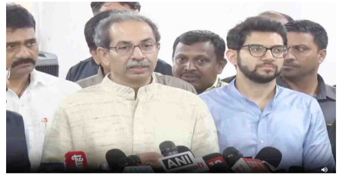
टीका उद्धव ठाकरे यांनी केलीय. पुढं बोलताना उद्धव ठाकरे यांनी सांगितलं की, 'जर कोणी काहीही करून भाजपामध्ये सामील झाला तर तो वांशिंग पावडरं स्वच्छ होतो. आमचा कोणत्याही भाषेला विरोध नाही. पण, कोणतीही भाषा

ठाकरे यांनी म्हटलंय. तसंच आज उर बडवायला देखील भाजपाकडे स्वतःची माणसं नसल्याची टीका उद्धव ठाकरे यांनी केलीय. 'महाराष्ट्राचे मंत्री आणि भाजपा नेते आशिष शेलार हे मराठी भाषेचे शत्रू आहेत. ते आपल्या मराठी लोकांची तुलना दहशतवाद्यांशी करतायत. हेच लोक आपल्या मराठीचे आणि आपल्या महाराष्ट्राचे मारेकरी आहेत. कारण, पहलगाम हल्ल्यात सहभागी असलेल्या दहशतवाद्यांची तुलना कोणाशीही होऊ शकत नाही. पहलगाममधील दहशतवादी भाजपामध्ये सामील झाले का? त्यांना अजून का पकडले गेले नाही? तुम्ही भारतातील हिंदूंचे रक्षण करू शकला नाही, हे लाजिरवाणे आहे, अशी