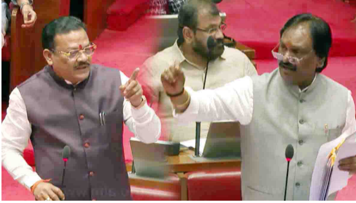
दिल्या, तर काही सदस्यांनी थेट शिरसाट यांच्या राजीनाम्याचीही मागणी केली. यानंतर महसूलमंत्री चंद्रशेखर बावनकुळे यांनी सगळी प्रक्रिया रद्द