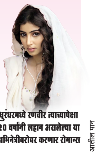
धुरंधरमध्ये रणवीर त्याचापेक्षा २० वर्षांनी लहान असलेल्या या अभिनेत्रीवर बर करणार रोमांस