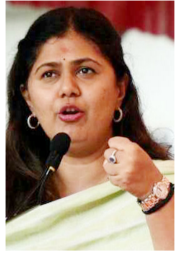
मुंडे यांनी यावेळी सांगितले.

२४ टक्के आहे. राज्यातील पशुसंवर्धन उत्पन्नाचा विचार करता भारतीय आरोग्य परिषदेने दैनंदिन आहारात शिफारस केलेल्या प्रमाणाइतके अंडी व मांस उपलब्ध नाही. तसेच दुग्ध उत्पादनात राज्यातील पशुधनाची उत्पादन क्षमता इतर राज्यांच्या तुलनेत कमी आहे. याशिवाय निती आयोगाच्या सन २०२१ च्या अहवालामध्ये पशुसंवर्धन क्षेत्रामध्ये नियोजनपूर्वक व शास्त्रीय पध्दतीचे व्यवस्थापन याकडे दुर्लक्ष होत असून त्यावर उपाययोजना करून शेतकरी, पशुपालकांच्या आर्थिक जोखीम कमी करण्याची शिफारस केली असल्याचेही पशुसंवर्धन मंत्री श्रीमती